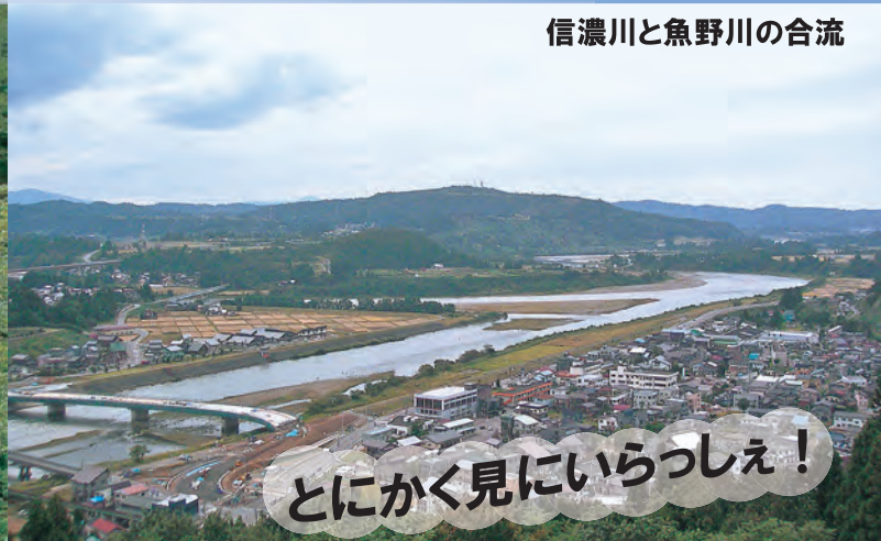
信濃川と魚野川の合流